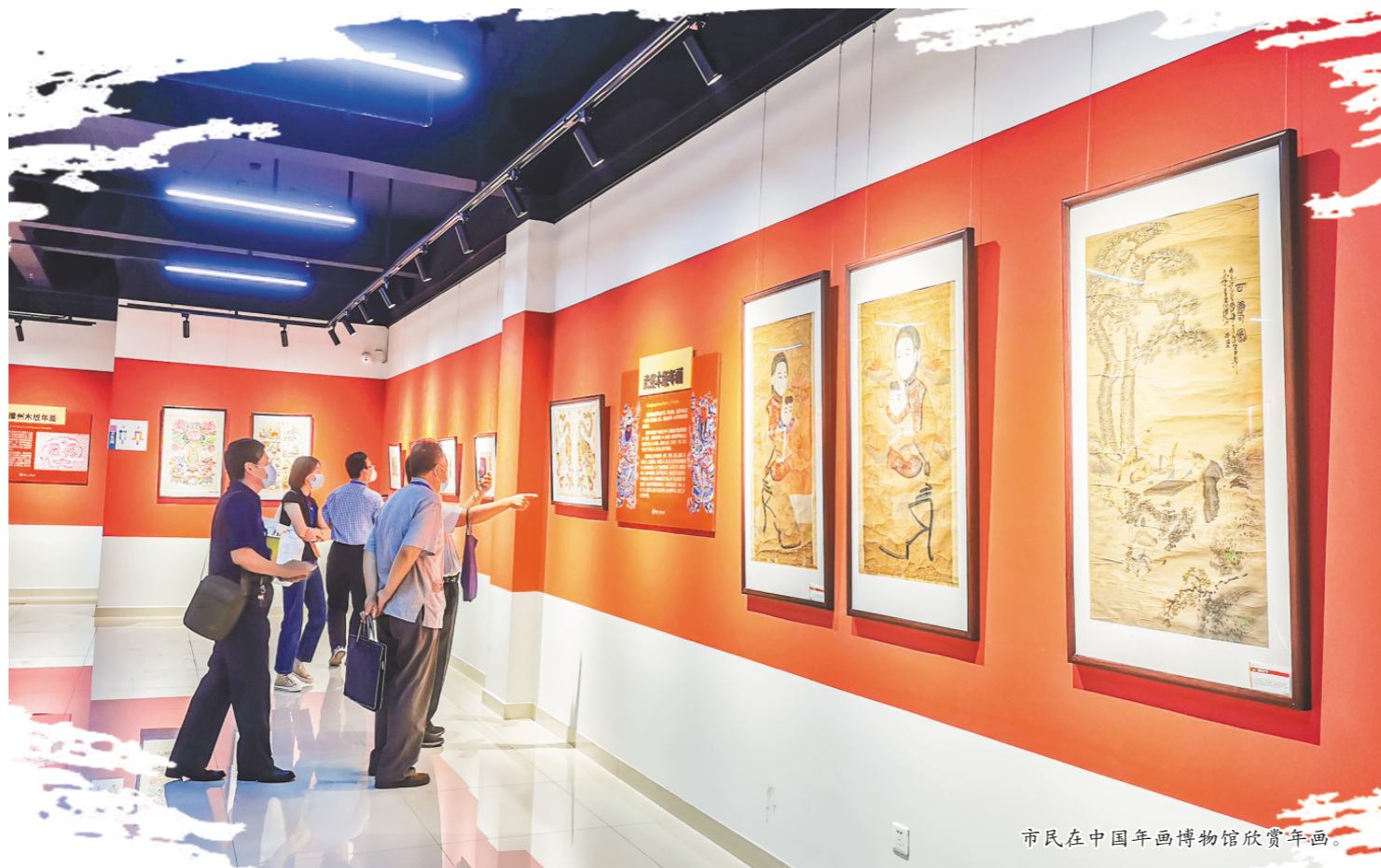
市民在中国年画博物馆欣赏年画。

年画是我市传统手工艺和民间美术的典型代表,也是最具代表性的中华文化符号之一。几百年来,年画见证着中华文化的传承与变迁,成为记录历史的重要载体、延续文脉的重要文化基因。近日,中国非遗协会年画专业委员会在潍坊成立,这是全国年画艺术领域的盛事,更是潍坊年画艺术600多年传承发展的里程碑,为年画艺术的传承发展增添了新动力。