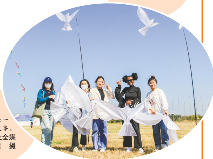
▶ 外国留学生与现场观众一同放飞和平鸽风筝。潍坊日报社全媒体记者 陈艺嘉 摄