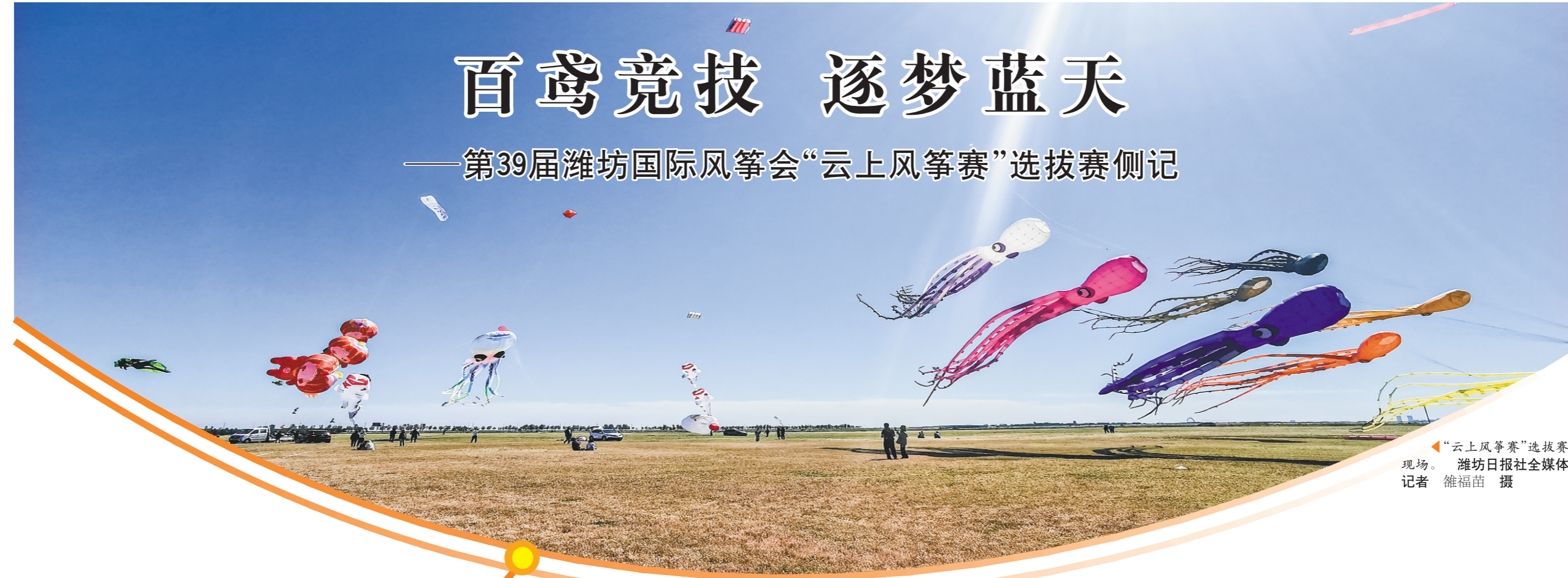
“云上风筝赛”选拔赛现场。