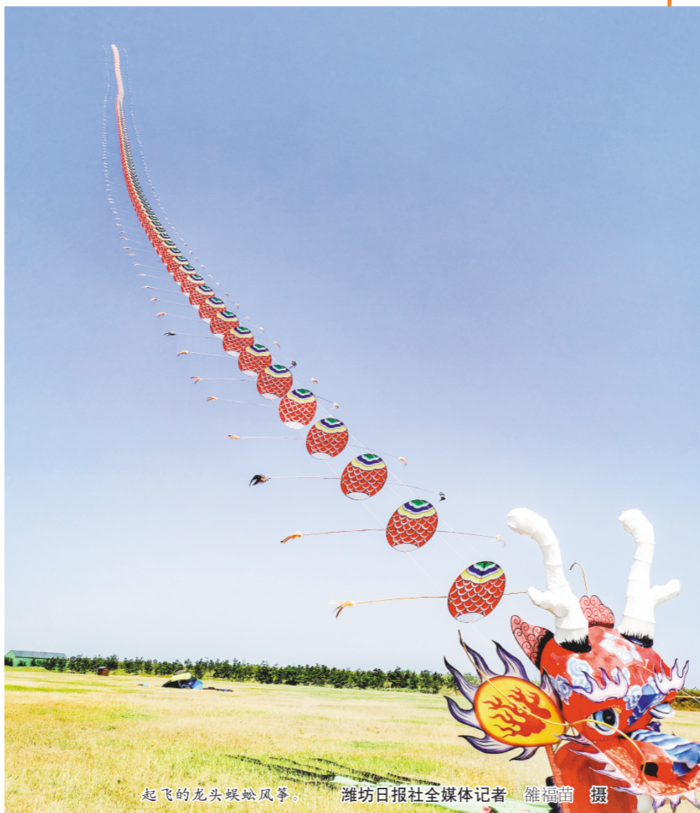
起飞的龙头蜈蚣风筝。