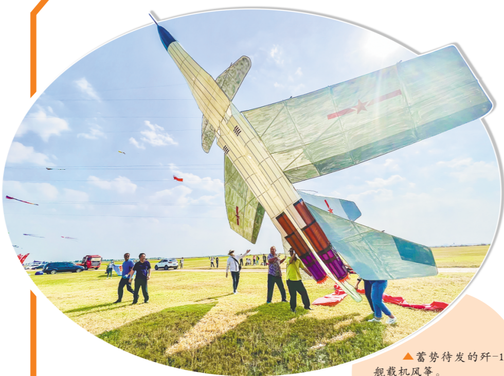
▲蓄势待发的歼-15舰载机风筝。

悠悠蓝天，缥缈薄云，数百只形态各异的风筝腾空而起，争奇斗艳，场面蔚为壮观。9月21日至25日，第39届潍坊国际风筝会“云上风筝赛”选拔赛在潍坊滨海国际风筝放飞场举行。通过选拔赛评选出的优秀风筝，将代表潍坊参加第39届潍坊国际风筝会“云上风筝赛”。