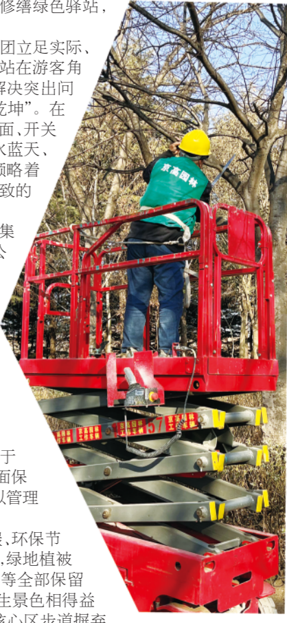
市文旅集团对湿地植被进行修剪。

生态兴则文明兴。良好生态环境是经济社会持续健康发展的重要基础，市文旅集团将把湿地生态文明建设放在突出地位，把绿水青山就是金山银山的理念印在脑子里、落实在行动上，以生态赋能人民生活品质提升，不断巩固拓展国有企业改革三年行动成果，助力潍坊加快建设新时代社会主义现代化强市。