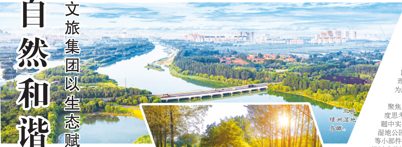
北辰绿洲湿地鸟瞰。