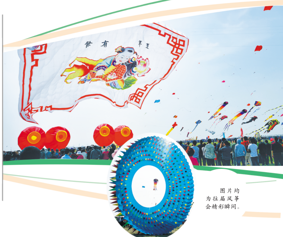
图片均为往届风筝会精彩瞬间。