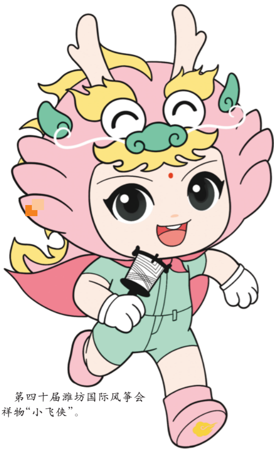
第四十届潍坊国际风筝会吉祥物“小飞侠”。

图标说明: 观众检票出入口 警戒线 围挡 卫生间 垃圾桶 凭开幕式门票领取风筝处