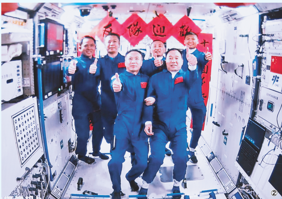
图①:5月30日在北京航天飞行控制中心拍摄的神舟十六号载人飞船与天和核心舱自主快速交会对接的模拟图像。图②:神舟十五号航天员乘组与神舟十六号航天员乘组拍下“全家福”。

据新华社北京5月30日电 5月30日9时31分,搭载神舟十六号载人飞船的长征二号F遥十六运载火箭在酒泉卫星发射中心点火发射。约10分钟后,神舟十六号与火箭成功分离,进入预定轨道。神舟十六号入轨后,于16时29分成功对接于空间站天和核心舱径向端口,整个对接过程历时约6.5小时。