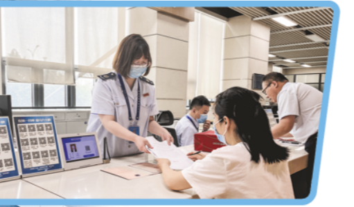
△潍坊市政务服务大厅业务办理窗口。