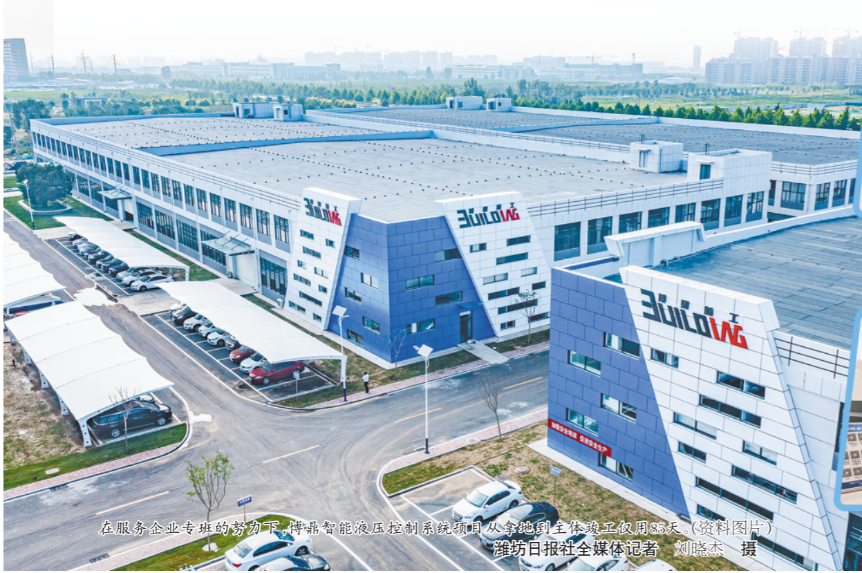
在服务企业专班的努力下,博鼎智能液压控制系统项目从拿地到整体竣工仅用85天。(资料图片)