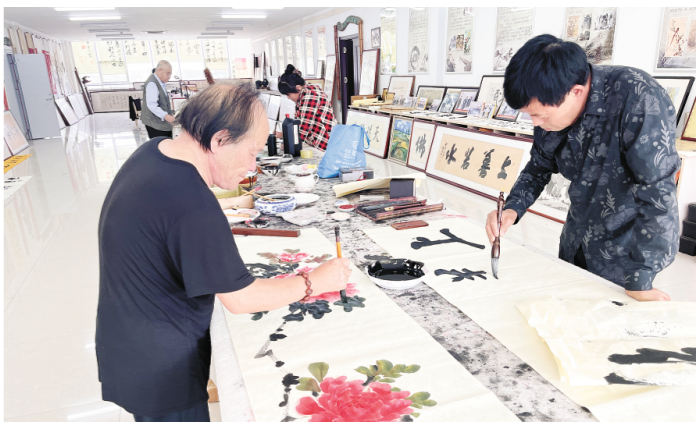
诸城市农民书画家协会的书画爱好者们在昌城镇举办书画联谊活动。

本报讯 （潍坊日报社全媒体记者 李国栋 通讯员 刘刚）诸城市昌城镇文化底蕴深厚，通过近年来不断完善文化平台载体，健全文化公共服务，打造了文化艺术节和昌城茂腔艺术节等多个文化品牌。新时代文明实践活动开展，培育了太极拳、广场舞等32支文化队伍，这其中，诸城市农民书画家协会就是典型的代表。