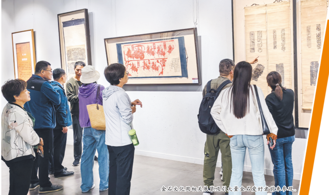
金石文化周相关展览吸引大量金石爱好者前来参观。

首次大规模举办的“天将金石付斯人”和“天开混沌由文字,人扩文明亦在兹”两个纪念陈介祺特展,从不同角度展示陈介祺的学术成就,许多展品是首次公开展出,具有极其珍贵的艺术和学术价值;致敬陈介祺·万印楼藏当代篆刻艺术大展,共展出万印楼10年来入藏的17个国家和地区的篆刻精品印章、印屏