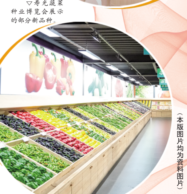
△寿光蔬菜种业博览会展示的部分新品种。

据介绍,寿光目前自主研发的蔬菜品种已达224个,国产蔬菜种子市场占有率从2010年的54%提升到现在的70%以上,其中黄瓜、圆茄、丝瓜等作物国产种子市场占有率达90%以上。