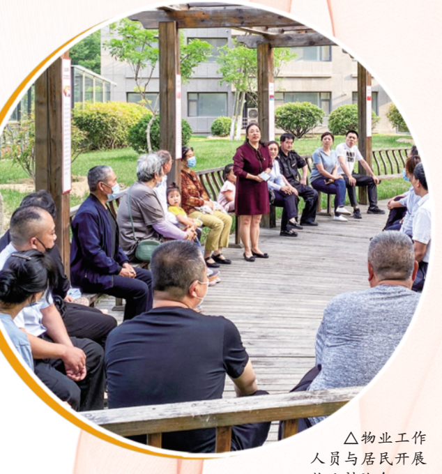
△物业工作人员与居民开展物业讨论会。