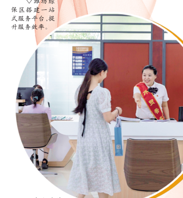
△潍坊综保区搭建一站式服务平台,提升服务效率。

潍坊综保区作为中国(潍坊)跨境电商综试区核心区,立足潍坊制造业强市、农业强市的优势条件,建起跨境电商产业园、“四合一”综合运营中心等平台,围绕农产品、纺织服装、机械装备等产业,实施“跨境电商+产业带”工程,构筑企业最优“生态圈”。今年上半年,潍坊综保区跨境电商“1210”出口业务规模居全省第1位。