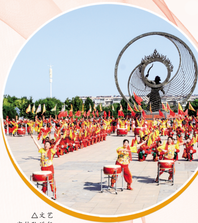
△文艺宣传队进行歌舞表演。

市文化和旅游局主要负责同志表示,下一步,将认真贯彻落实党的二十大精神,以深化县域公共图书馆、文化馆总分馆制为抓手,以推进城乡15分钟品质文化生活圈建设为重点,进一步建立健全优质文化资源直达基层机制,着力构建各级各类文化场馆融合、资源共享、互联互通的公共文化服务网络,不断满足人民群众多样化、多层次、多方面的精神文化需求,到2027年在全市城乡形成资源共享、互联互通、有效覆盖、特色鲜明的公共文化服务网络,显著缩小城乡、区域、群体之间差距,提高公共文化服务公平性、便捷性、可及性,推动城乡公共文化服务体系一体建设高质量发展,为加快建设实力品质生活美的更好潍坊提供强大精神动力和文化支撑。