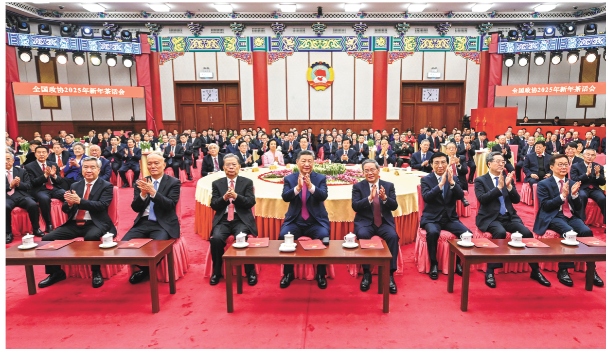
2024年12月31日，全国政协在北京举行新年茶话会。党和国家领导人习近平、李强、赵乐际、王沪宁、蔡奇、丁薛祥、李希、韩正出席茶话会并观看演出。