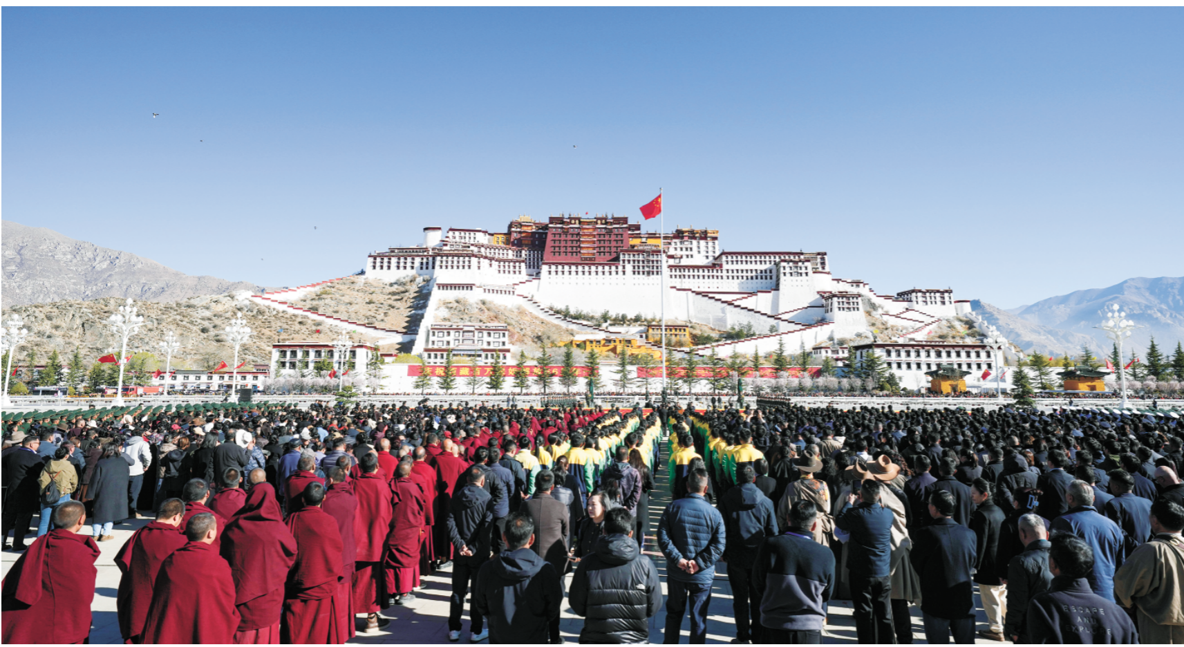
3月28日，西藏各族各界代表齐聚布达拉宫广场，参加升旗仪式。当日，西藏各族各界群众升国旗、唱国歌、载歌载舞，隆重纪念西藏百万农奴解放66周年。

白皮书强调，新时代西藏人权事业取得的历史性成就，是沿着中国人权发展道路在雪域高原书写的壮丽华章，力度前所未有，成就前所未有。在以中国式现代化全面推进中华民族伟大复兴的新时代新征程上，中国共产党和中国政府将继续顺应西藏各族人民对美好生活的期待，推动西藏人权事业实现更高质量的发展，续写雪域高原人权保障新篇章。