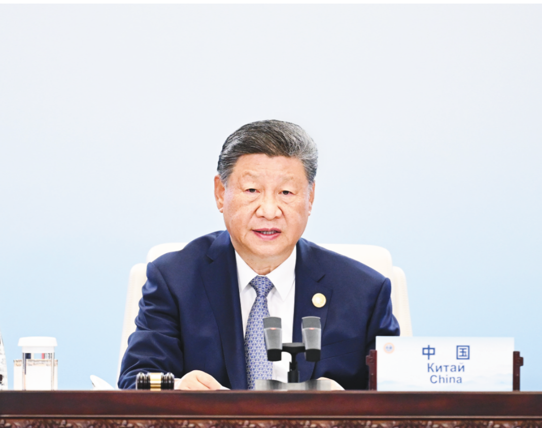
9月1日上午，上海合作组织成员国元首理事会第二十五次会议在天津梅江会展中心举行。中国国家主席习近平主持会议并发表题为《牢记初心使命 开创美好未来》的重要讲话。