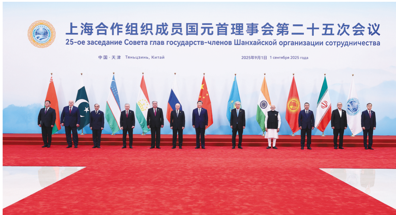
上海合作组织成员国元首理事会第二十五次会议 25-ое заседание Совета глав государств-членов Шанхайской организации сотрудничества