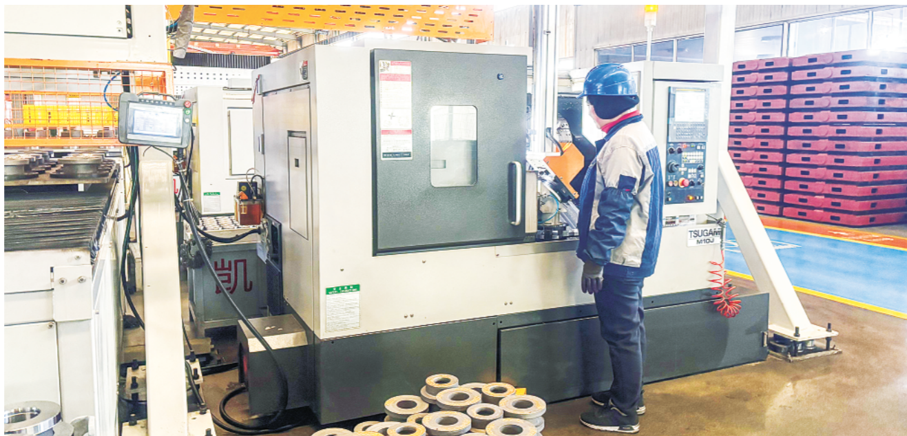
潍坊市凯隆机械有限公司车间内，机械设备全力运作，生产线一片繁忙，工人们正加紧赶制订单。

“我们因企施策，按企所需提供服务，个性化满足企业需求。设立项目建设办公室，定期召开项目推进会，协助推动项目手续办理、落地施工和投产达效。建立需求服务台账，详细记录企业基本信息，及