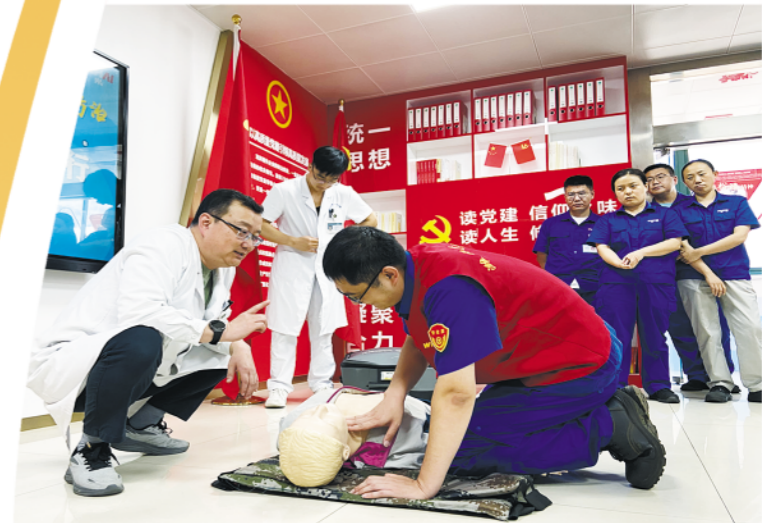
△潍坊市劳模工匠助企服务队走进潍柴，开展应急救援普及培训活动。

诊+线下攻坚+成果转化”一体化服务，提升服务精准度和实效性，并深化品牌内涵建设，讲好劳模工匠助企故事，让劳模工匠精神在全社会蔚然成风，书写更多“匠心助企、工会护航”的崭新篇章。