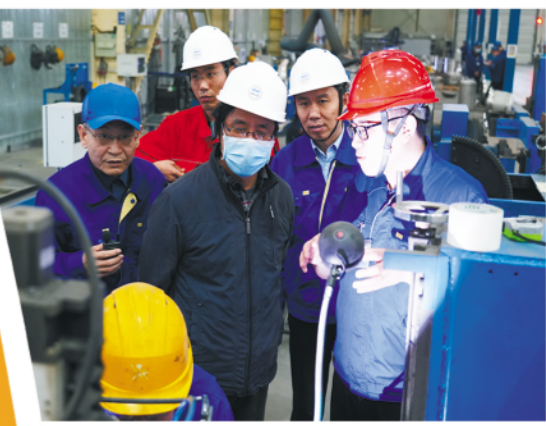
△全国劳动模范、大国工匠高凤林(右三)在豪迈集团开展助企服务。

验市总工会精心打造的“劳模工匠助企行”线上供需服务平台后，难掩喜悦地感慨。 科技赋能，服务提档。该平台依托潍坊市劳模工匠学院网站搭建，实现企业需求“线上发布”、工会“在线审核派单”、劳模工匠“线上接单”、服务效果“线上反馈”的全流程信息化管理。工会通过平台实时监控服务进度、精准掌握成效数据，帮扶时长、攻克难题、企业满意度等信息一目了然。同时，平台集成专家库查询、需求智能匹配、服务信息发布等功能，让供需对接从“线下跑腿”的漫长等待，变为“线上秒配”的高效便捷，极大提升了助企服务的效率与精准度，真正打通服务企业的“最后一公里”，让技术帮扶随时随地、直达一线。