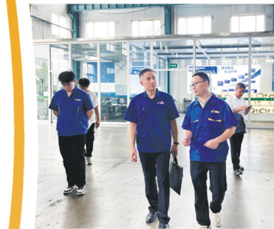
△全国劳动模范、大国工匠王树军(中)走进青州市建富齿轮开展助企服务。