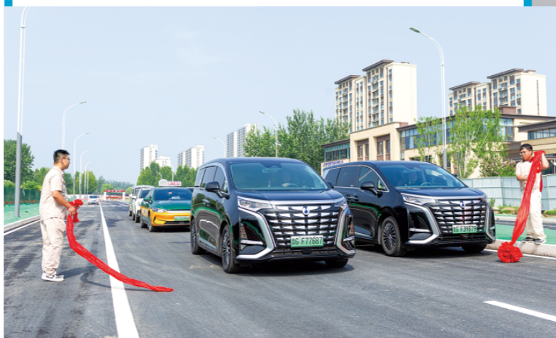
△乐川街（清平路-奥体北路）通车。