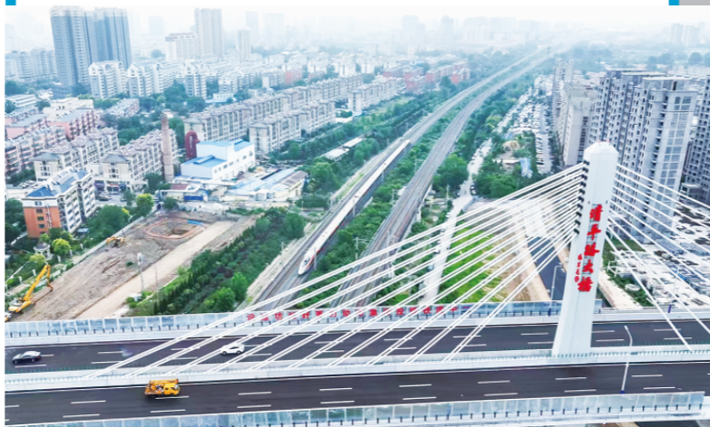
△清平路跨铁路立交桥主桥。