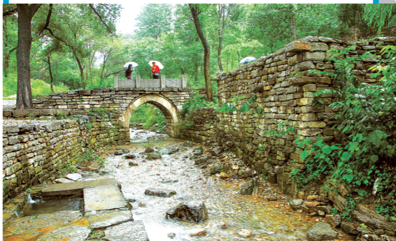
△青州市国家级传统村落——井塘村。