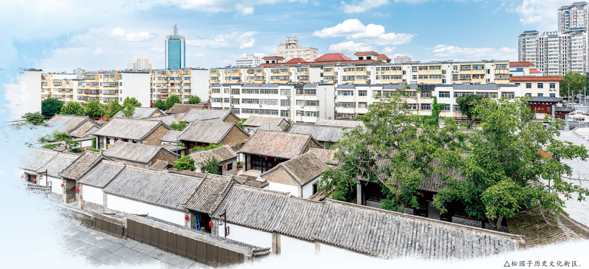
△松园子历史文化街区。

今年以来，潍坊市住房和城乡建设局紧紧围绕高质量发展首要任务，以“匠心”塑精品，以“实干”惠民生，统筹推进城市建设、村镇发展、房地产转型、产业升级与政务服务优化等工作，圆满完成年度各项目标，在提升城市能级、改善人居环境、服务经济社会发展大局中书写了浓墨重彩的篇章。