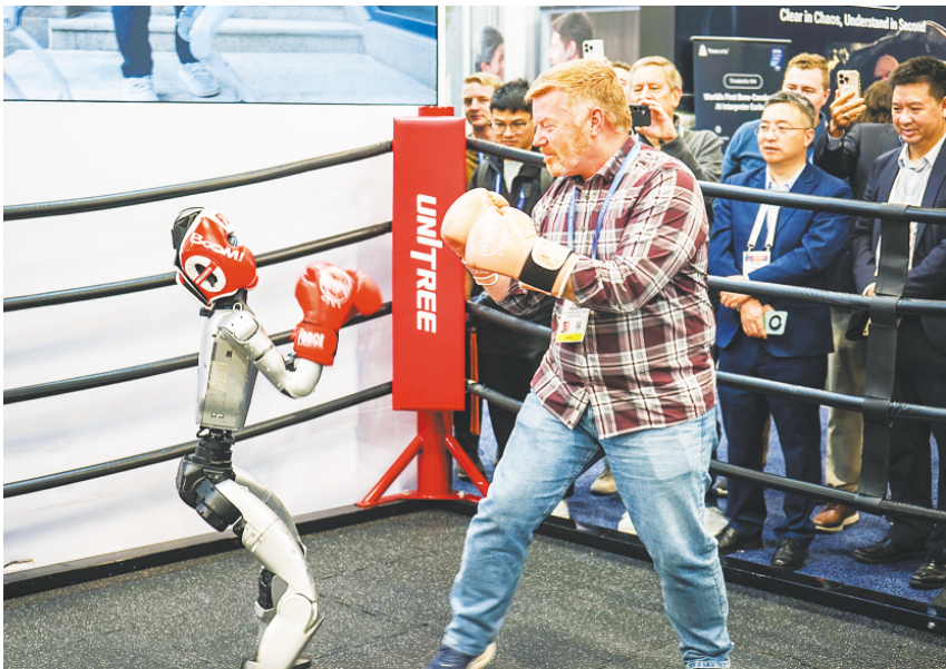
1月8日,在美国拉斯维加斯消费电子展上,参观者与宇树机器人互动。

整体看来,CES正在由“前沿技术秀场”转向“产业落地试验场”,AI深度融入操作系统、车辆平台和工业控制系统,成