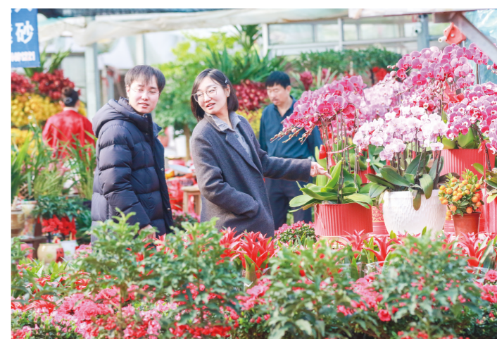
春节临近，位于高密柏城镇的花卉批发市场迎来黄金销售期，人们纷纷选购蝴蝶兰、仙客来等各种年宵花营造浓厚节日氛围，喜迎春节。图为人们在花卉批发市场选购年宵花。记者 付生 通讯员 李海涛 摄

新华社北京2月9日电（记者 叶昊鸣 王隼昊）2026年春运开启已满一周，记者9日从交通运输部获悉，春运首周（2月2日至8日），全社会跨区域人员流动量超14亿人次。其中，公路人员流动量超13亿人次，铁路客运量超8600万人次，水路客运量超490万人次，民航客运量超1600万人次。 2月8日（春运第7天），全社会跨区域人员流动量为22771.3万人次，比2025年同期增长2.3%。 具体来看，公路人员流动量为21117万人次，比2025年同期增长2.5%。其中，高速公路及普通国道非营业性小客车人员出行量为17680万人次，比2025年同期增长2.3%；公路营业性客运量为3437万人次，比2025年同期增长3.5%。 铁路客运量为1344.2万人次，比2025年同期下降1.1%。水路客运量为75.3万人次，比2025年同期增长10.4%；民航客运量为234.8万人次，比2025年同期增长5.6%。