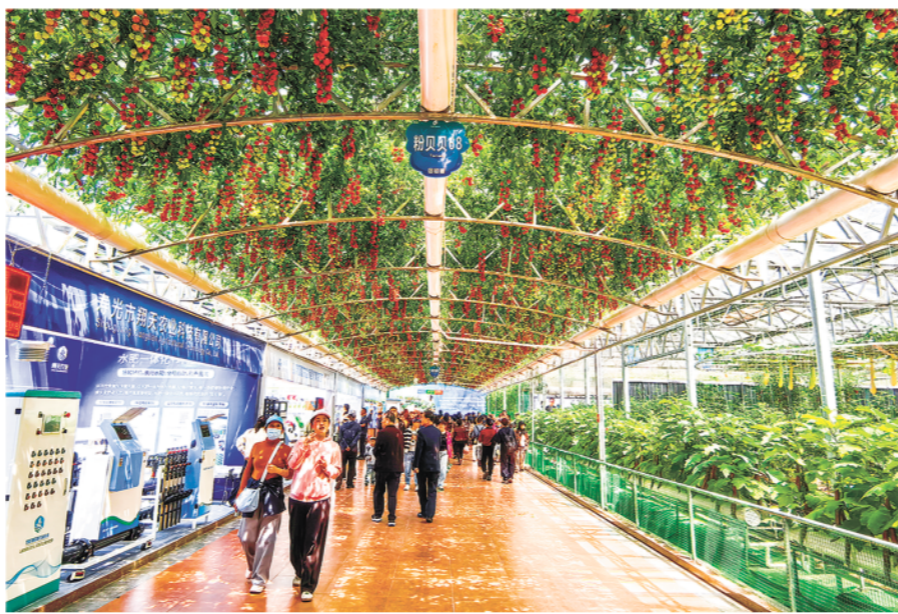
茶博会上，蔬菜种植尽显“科技范”。记者 高文 摄