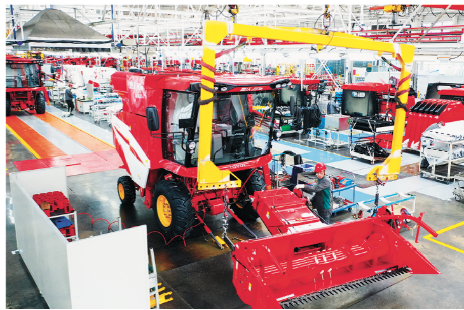
潍柴雷沃生产车间。