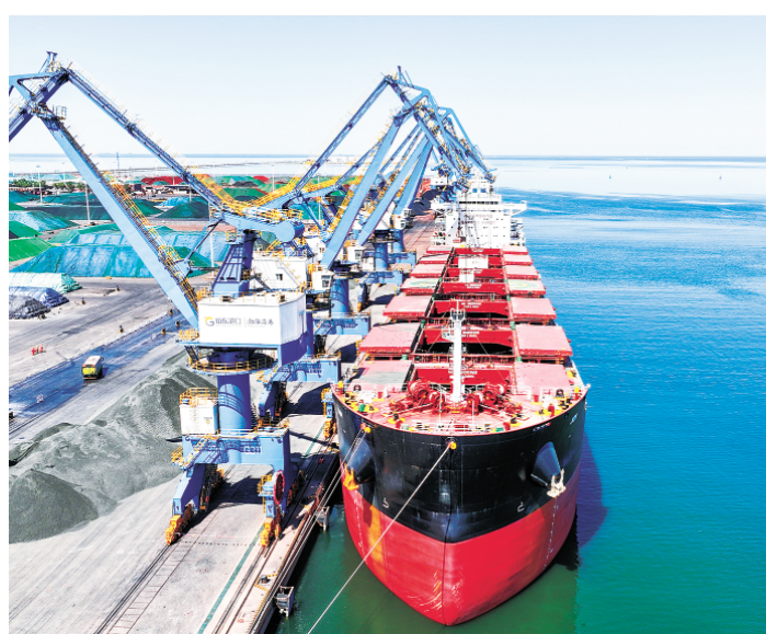
外贸展现良好态势。