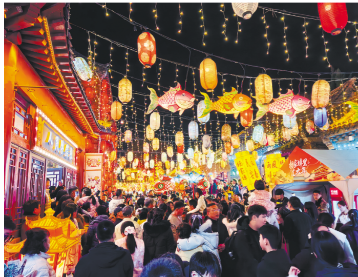
杨家埠民间艺术大观园里流光溢彩(资料图片)。

潍坊将政策优势转化为产业优势，将服务效能转化为市场竞争力，在稳外贸、拓市场的过程中，持续夯实开放型经济的内在支撑，为特色产业参与国际竞争、拓展全球市场奠定更为坚实的基础。