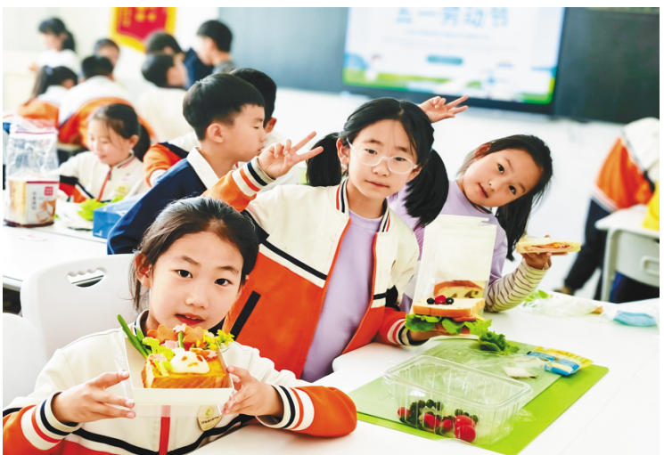
4月30日,高新区惠春学校举办了一场迎“五一”主题手工制作活动。同学们亲手搭配食材制作三明治,在动手实践中感受劳动乐趣,以别样方式迎接劳动节的到来。

常态防控不松,夯实长效“压舱石”,该局持续绷紧森林防火这根弦,紧盯民俗活动、节假日出游等关键时段,常态化开展巡护管控,以“时时放心不下”的责任感,严守生态安全底线,让绿水青山在常态化防护中永葆生机。