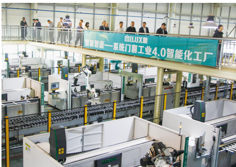
与会人员到山东米兰之窗系统门窗幕墙有限公司数字化车间现场观摩。

近年来，临朐工业“智改数转”步入“快车道”，但部分企业特别是中小企业仍存在“不敢改”“不会转”等问题，为帮助这部分企业解决实际困难，打消思想顾虑，在更大范围、更深度实施“智改数转”，一场协商座谈会就此应运而生。 与会人员先后走进三家实施“智改数转”的标杆企业。在华建铝业集团智能制造中心，自动化生产线高速运转，中控大屏实时同步生产数据，全流程实现智能化管控。“通过‘智改数转’，生产效率提升了25%，运营成本降低了20%，而且产品加工精度得到进一步提升。”